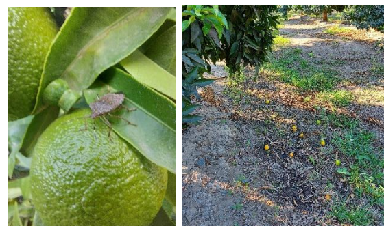
Photo 1 : Punaise diabolique sur fruit et présence de fruits chutés au pied de l'arbre.

Gestion du risque : Il est possible de réaliser des pièges à base de phéromones pour limiter l'infestation.